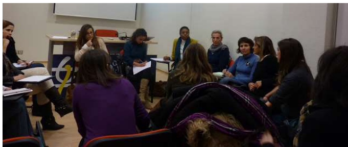
Reunión Mapa de la Mediación diciembre

La sesión se centró en un primer momento en los aspectos legales, implicaciones y repercusiones en el ámbito de trabajo de la Mediación, llamando la atención acerca del arraigo que en otros países europeos tiene este procedimiento, no así en España. Se exploró la definición de la figura del mediador, con sus características más distintivas, remarcando la necesidad de una formación específica pero no una titulación concreta, remarcándose la especial capacitación del profesional de la Psicología en el ámbito de la Mediación Familiar. Se expusieron los principales ámbitos de aplicación de la mediación, y las peculiaridades que comportan así como elementos distintivos de la misma como su carácter no obligatorio. Finalmente se llamó la atención acerca de las implicaciones que para la psicología tenía la nueva ley, así como la justificación de su necesidad y mejoras. Se reflexionó sobre la importancia del nuevo papel de los Colegios Profesionales como instituciones de mediación y por último se concluyó la importancia acerca del papel de la Mediación como mecanismo para descongestionar los tribunales y como medio de pacificación social.